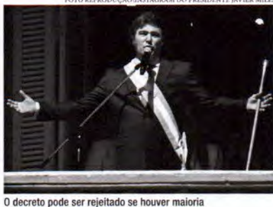
O decreto pode ser rejeitado se houver maioria contrária na Câmara de Deputados e no Senado

Após o anúncio do polémico decreto, milhares de pessoas marcharam em direção ao Congresso Nacional de Buenos Aires. Milesi, acompanhado de outros líderes, chegou ao local durante o pronunciamento de Milei, também ocorreu um boicote. O presidente defende que as medidas anunciadas são