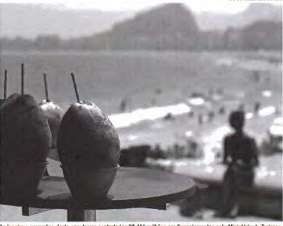
De janeiro a novembro deste ano, foram contratados R$ 466 milhões em financiamentos pelo Ministério do Turismo