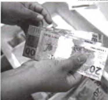
O projeto deve ser votado pelo plenário na segunda-feira (2) em sessão remota

O projeto precisa ser aprovado pelos senadores e sancionado pelo presidente Lula até 3 de outubro, dia que expira a medida provisória que criou o programa. Nessa quarta (27), Cunha anunciou apenas um ajuste no texto, para deixar claro que o limite