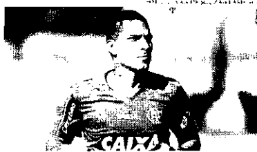
Atacante peruano deixará a Gaveia amanhã e fechará contrato

Guerrero disputou apenas sete partidas pelo Flamengo nesta temporada e marcou um gol. Esteve afastado devido a punição por doping, mas disputou a Copa do Níntaro e voltou a atuar sob efeito suspenso.