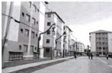
Os bancos podem procurar o cartório para executar contrato, após 3 parcelas em atraso

O STF (Supremo Tribunal Federal) validou a possibilidade de bancos tomarem, sem decisão judicial, imóveis financiados com parcelas atrasadas. Sem chance de contestação do devedor, o processo pode ser feito em 30 dias.