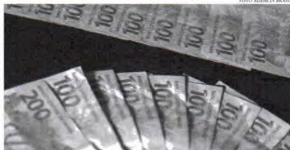
Com esses dados, resultado de junho foi o pior para o mês desde 2021, quando houve déficit primário de R$ 73,474 bi

Em janeiro, havia sido registrado superávit de R$ 78,326 bilhões, mas os resultados negativos dos meses seguintes reverteram a