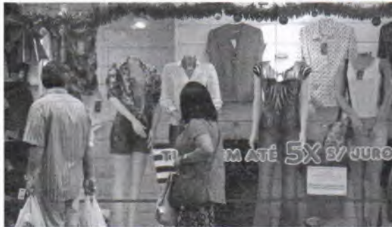
O avanço na intenção de consumir em junho foi mais expressivo entre os consumidores de rendas média

A intenção de consumo das famílias brasileiras cresceu 2,6% no mês de junho. A afirmação é da pesquisa nacional de Intenção de Consumo das Famílias (ICF), divulgada nessa quinta-feira (22/06), pela Confederação Nacional do Comércio de Bens, Serviços e Turismo (CNC). No ano, o aumento é de 21,3%. A CNC diz que embora estejam mais confiantes no futuro do emprego, os brasileiros estão também endividados e enfrentando restrições de crédito, o que, além dos juros altos, também são situações que limitam o consumo. Esses fatores, segundo a entidade, fazem com que as vendas do varejo e dos serviços desacelerem. A intenção de consumo é um indicador antecedente do potencial das vendas do comércio e é aferido de forma mensal. Além disso, os resultados medem o grau de satisfação e insatisfação dos consumidores em uma escala de até 200 pontos. Quando o índice está abaixo de 100 pontos, isso indica percepção de insatisfação. Já quando está acima de 100, sinaliza satisfação. O avanço na intenção de consumir em junho foi mais expressivo entre os consumidores de rendas média e