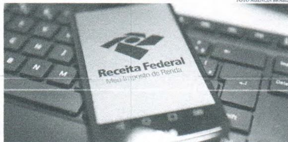
Um dos fatores para o recorde é que o uso da declaração pré-preenchida prioriza para receber eventual restituição

No ano passado, um total de 2.633.646 contribuintes usaram a declaração pré-preenchida, o equivalente a 7% das 36.403.675 declarações recebidas pela Receita. Um ano antes, o recurso estava em testes e foi utilizado em 360.917 declarações (1% do total). Um dos fatores que pode ter colaborado para o recorde é o uso da declaração pré-preenchida de prioridade de contribuinte para receber uma eventual restituição,