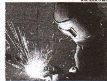
O número de horas trabalhadas na produção também avançou 0,8% em dezembro de 2022, na comparação com novembro

Além disso, em dezembro de 2022, o faturamento real da indústria de transformação recuou 0,4% em relação ao mesmo período de novembro.