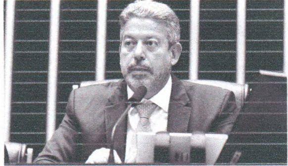
A criação do bloco foi selada em reunião na manhã desta quarta-feira (12) com Arthur Lira (PP)

O pano de fundo dessa movimentação envolve a disputa de poder dentro do Congresso, a força que cada agrupamento terá na relação com o governo federal e a própria sucessão do presidente da Câmara – que ocorrerá em fevereiro de 2025.