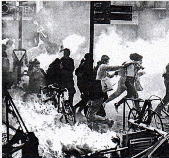
Em algumas cidades, as forças de segurança precisaram usar gás lacrimogêneo para conter os manifestantes

Após dias de silêncio, nesta semana, o presidente Emmanuel Macron, que apoia a reforma aprovada, se manifestou pela primeira vez sobre a situação vivida no país. O chefe de Estado garantiu que não sente "nenhum prazer" em realizar tal reforma. No entanto, seria algo necessário financeiramente, uma vez que a questão demográfica colocaria o sistema previdenciário em desequilíbrio. "Hoje temos 17 milhões de aposentados e, em 2030, teremos 20 milhões. Vocês acham que conseguimos manter o mesmo sistema?", questionou.