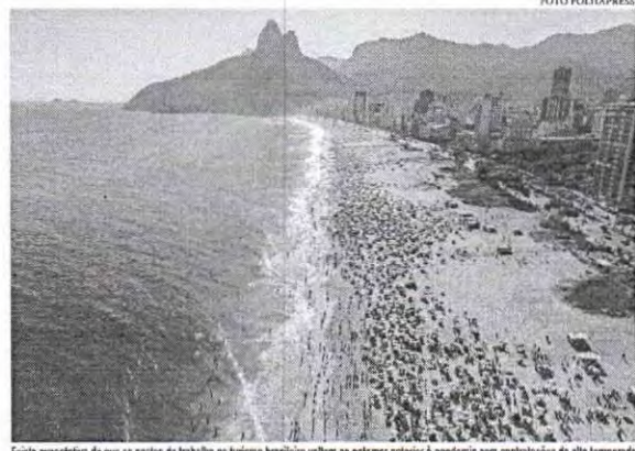
Existe expectativa de que os postos de trabalho no turismo brasileiro voltem ao patamar anterior à pandemia com contratações de alta temporada

Apesar das boas perspectivas para o turismo, os gastos de turistas estrangeiros no Brasil permanecem 24% abaixo de 2019, segundo o Banco Central. O fluxo diário de aeronaves nos dez principais aeroportos do país, por exemplo, segue abaixo do