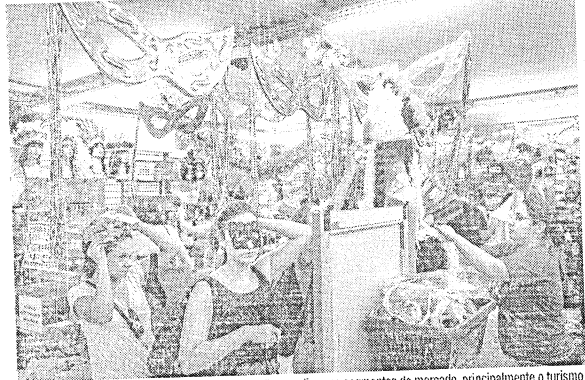
Carnaval de 2023 deve gerar novos postos de trabalho em diversos segmentos do mercado, principalmente o turismo

O carnaval de 2023 deve movimentar R$ 8,18 bilhões em receitas no país, montante 26,9% superior ao registrado no ano passado, mas 3,3% abaixo do registrado em 2020, o último carnaval realizado antes da pandemia de covid-19. A projeção é da Confederação Nacional do Comércio de Bens, Serviços e Turismo (CNC). Ainda segundo a entidade, cerca de 85% da receita deve ser gerada por três segmentos: bares e restaurantes, cuja movimentação esperada é de R$ 3,63 bilhões, transporte de passageiros, com movimento de R$ 2,35 bilhões, e o setor de serviços de hotelaria e hospedagem, com movimentação de R$ 890 milhões. No campo geral, 15% se dividem entre empresas de lazer e cultura (R$ 780 milhões) e outros segmentos, como aluguel de veículos e agências de viagem, por exemplo (R$ 550 milhões). "Os reajustes de preços de praticamente todos os segmentos, o aumento significativo da taxa de juros e o alto comprometimento da renda com dívidas fazem com que os gastos com lazer sejam comedidos, mas ainda assim consideravelmente maiores do que em 2021", explicou o presidente da CNC, José Roberto Faddes, ao observar que o principal obstáculo ao restabelecimento das receitas ao nível pré-pandemia é o atual contexto econômico menos favorável.